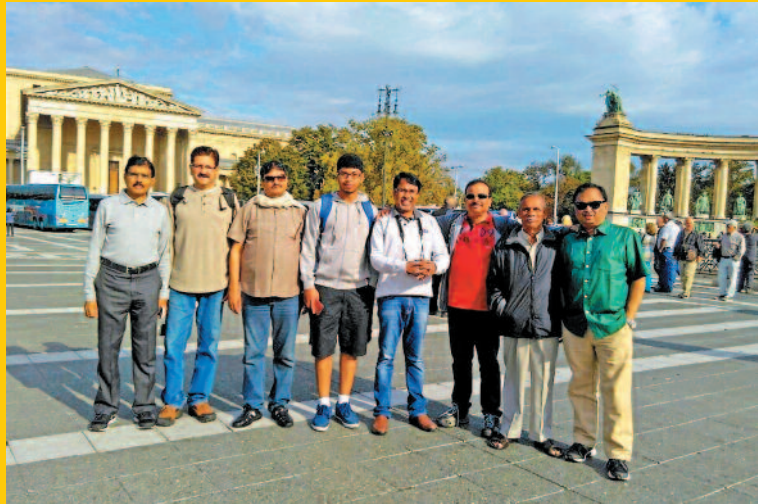
ಹೀರೋಸ್ ಸ್ಟೇರ್‌ನಲ್ಲಿ ಸ್ನೇಹಿತರೊಡನೆ ಲೇಖಕ (ಬಲದಿಂದ ಮೊದಲನೆಯವರು)